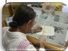
材料をみじん切りにし、混ぜ合わせ肉まんの具の完成！